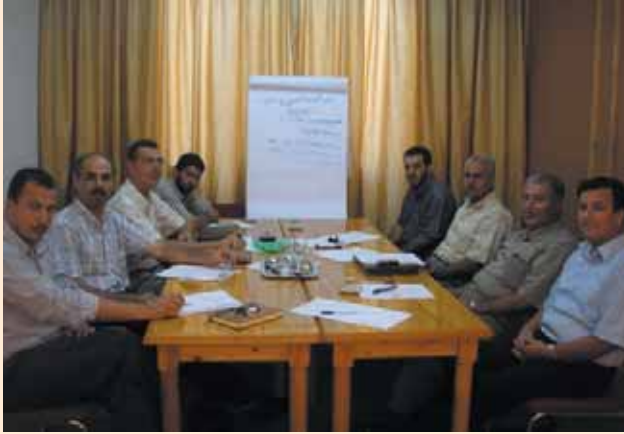
اجتماع في مركز غزة الجديد للزراعة الحضرية Meeting at the new Gaza Urban Agriculture Center (GUAC)