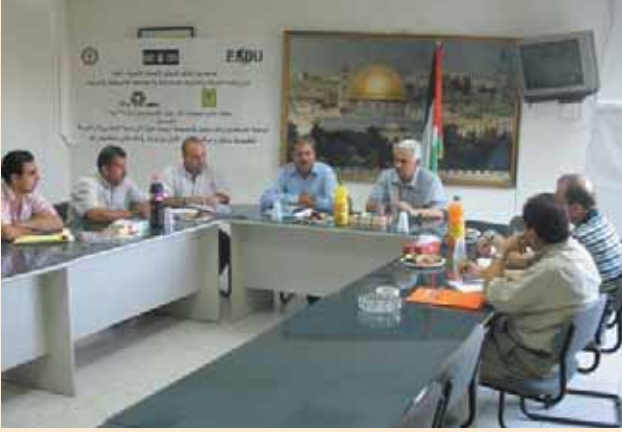
اتحاد جمعيات المزارعين الفلسطينيين وبلدية أريحا Palestinian Farmers Union (PFU) and the Municipality of Jericho