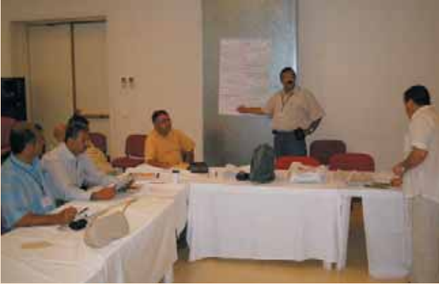
بعض المشاركين خلال التدريب الإقليمي حول الزراعة الحضرية Participants from the regional training on Urban Agriculture

IDRC and ESDU join forces in mainstreaming urban agriculture in MENA region through several activities which are presented in this article.