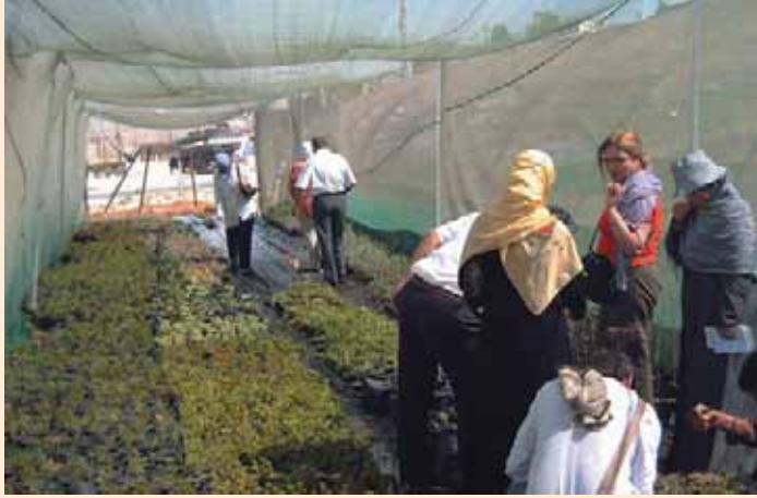
زيارة اعضاء فرق المدن المشاركة لمشغل مشروع تطوير الحديقة المنزلية

Members of the participating cities in the workshop September 2007 visiting the nursery of the "Development of Home Gardens" project.