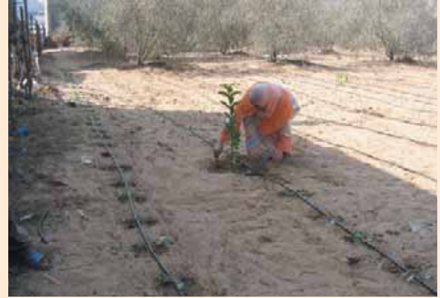
نظام الري بالتنقيط في احدى حدائق الأسر Drip irrigation system in one of the household gardens

The concept of the project is based on establishing the Gaza Urban Agriculture Centre (GUAC) as a Palestinian center for the development and promotion of the practices of urban agriculture. The centre is expected to become active at the various local, regional and international levels in addition to becoming a reference for all those interested in developing urban agriculture.