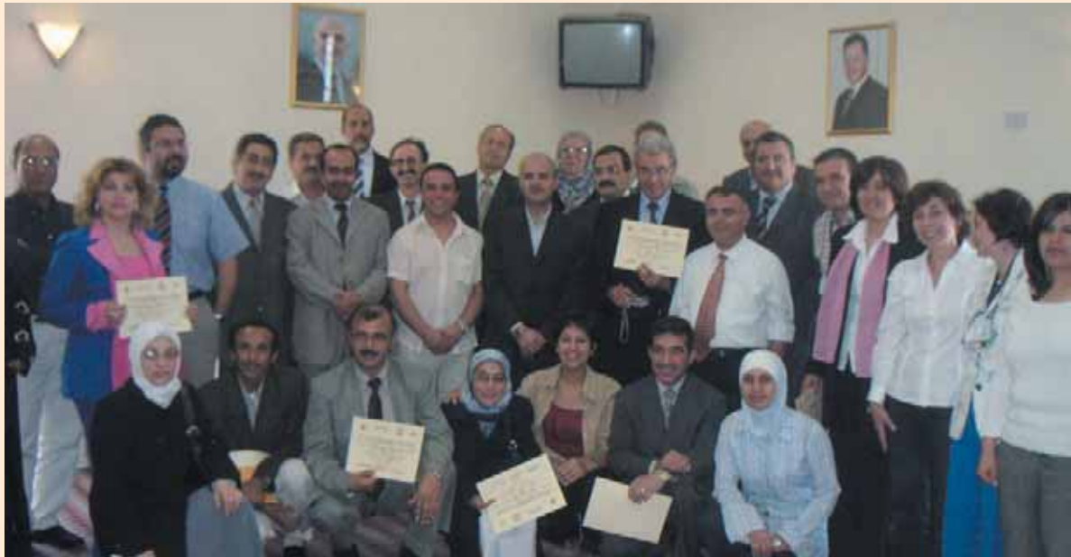
حفل توزيع الشهادات في نهاية دورة التدريب الاقليمي وتشارك المعرفة حول الزراعة الحضرية لبلدان الشرق الاوسط وشمال إفريقيا في أمانة عمان - الاردن Certificates of completion awarded to the participants of the "Regional Training and Information Sharing on Urban Agriculture in the Middle East and North Africa" at the Municipality of Amman - Jordan

Welcome to this special issue of Urban Agriculture in the MENA region which summarizes the activities related to Urban Agriculture that are executed by the Environment and Sustainable Development Unit (ESDU) of the American University of Beirut (AUB) across the Middle East and North Africa (MENA) Region.