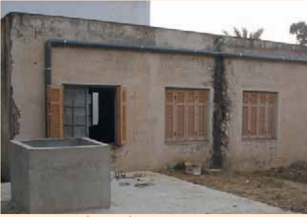
الفسقية وقنوات حصاد مياه الأمطار عبر الأسطح The water tank and the rooftop water harvesting pipes