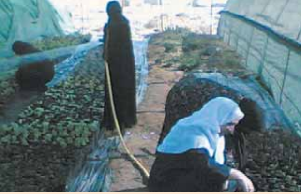
نساء مشاركات يتدربن في مشتل الجمعية

Women participating in the project training in the nursery