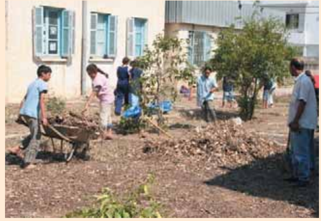
حديقة مدرسة الفردوس خلال التهيئة Land preparation in the "Ferdos School" garden