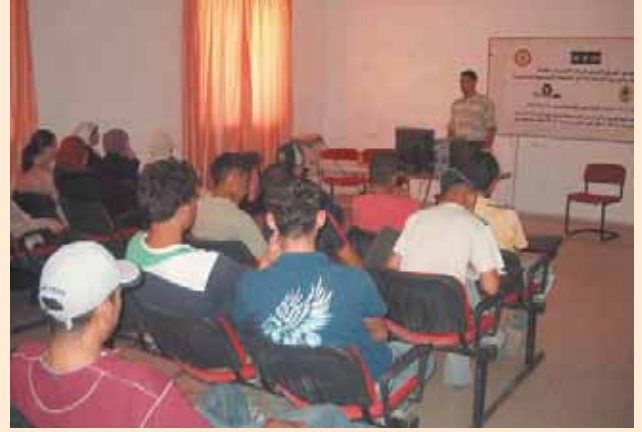
تدريب عدد من المواطنين والمزارعين عن الزراعة الحضرية A training for citizens and farmers on urban agriculture

The idea of the project was conceived when Jericho Municipality adopted an innovative concept for managing and embellishing the city to produce food from home gardens and idle lands, since urban agriculture has long been neglected as a main supplier of providing food for the residents of the city. This project is funded by the Environment and Sustainable Development Unit (ESDU) of the American University of Beirut and the International Development Research Centre (IDRC) with the main objective of raising the awareness of farmers and citizens of Jericho on the importance and role of urban agriculture in preserving the environment and biodiversity of the city. Jericho the Capital of the Jordan Valley was, and still is, the eastern gate of Palestine. Located 276m below sea level, it is the center of vegetable production in the country.