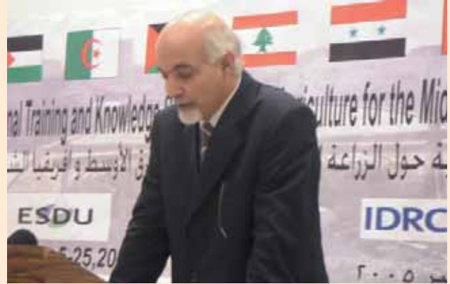
معالي وزير الزراعة اللبناني الاستاذ طلال الساحلي خلال حفل الافتتاح Lebanese Minister of Agriculture H. E. Talal El-Sahili at the opening ceremony

The course was designed in a way to address the broadest base possible of stakeholders, and hence participation was open to city teams of 3 persons and requested an implicit endorsement from the municipalities of the concerned cities. Teams were composed of municipal council member or a middle-to-upper management person in the municipality, one participant from an NGO and one person from a farmer union, public or private research institution and/or the private sector working in agriculture within the city