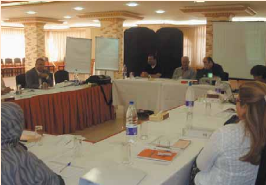
تدريب المدربين حول عملية صياغة السياسات ووضع خطة عمل لأصحاب المصلحة المتعددين في عمان - الأردن أيلول ٢٠٠٧

- أسست وحدة البيئة والتنمية المستدامة بالتعاون مع منظمة الأغذية العالمية منصة للتواصل من أجل التنمية في الشرق الأدنى لتكون بوابة لتشارك المعلومات والتجارب في هذا المجال. ويهدف هذا المنبر إلى تطوير أرشيف للمواد التي أعدت حول موضوع التواصل من أجل التنمية في المنطقة وتشكيل مساحة حقيقية للتفاعل وتشارك الخبرات وتطوير المفاهيم المتعلقة بالتحديات المرتبطة بموضوعي التواصل والتنمية.